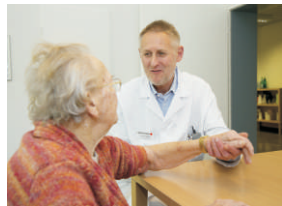
Klinik für Fachübergreifende Frührehabilitation Dr. med. Heinz-Jürgen Harhoff