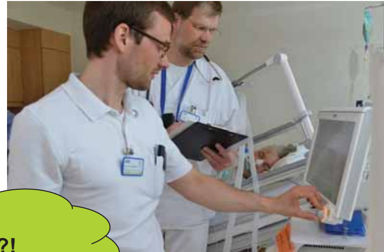
im Team arbeiten...