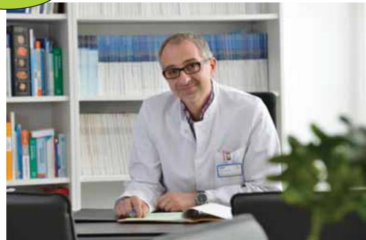
...und wann kommen Sie zu uns?