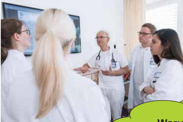
learning by doing ...