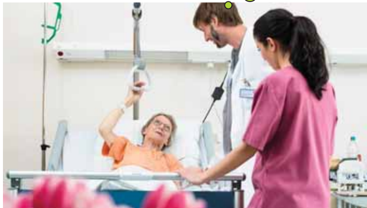
direkter Patientenkontakt ...