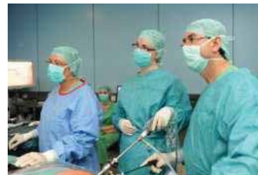
Hohe Kompetenz in Ausbildung und Medizin