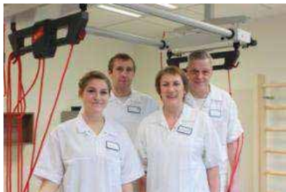
Guter Umgang miteinander