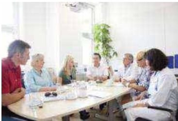
Planen und Arbeiten im Team