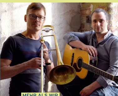
MEHR ALS WIR