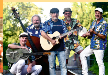
FRONT PORCH PICKING