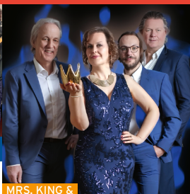
MRS. KING & HER JEWELS