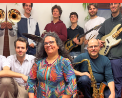
MAX FUNK INSTITUTE