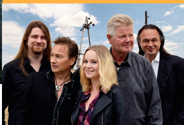
THE NEW HORSES