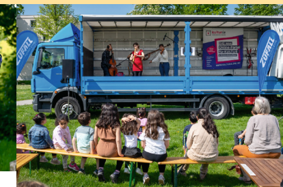
DER ROLLENDE GEORG